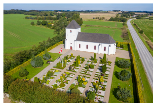
Mylund Kirke Mylundvej 91 9740 Jerslev