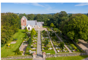
Hellum Kirke Kræmmergårdsvej 10 9740 Jerslev

Konfirmandstuen Borbergade 34 9740 Jerslev