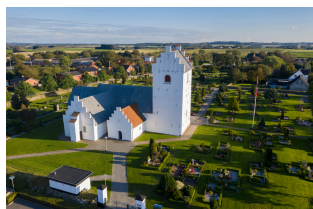
Jerslev Kirke Borbergade 35 9740 Jerslev

Konfirmandstuen Borbergade 34 9740 Jerslev